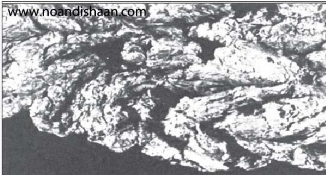
شکل ۱- اکسید آلومینیم نرمتر که از روی بوته کف گیری شده است.