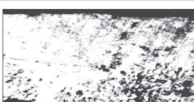
www.noandishaan.com شکل ۹- پراکندگی ذرات کوراندوم با یک تکه بزرگ (سمت چپ) که به صورت تخلخل نیز به نظر می آید.