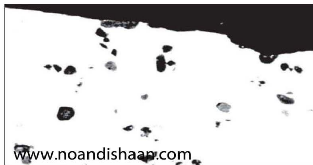
www.noandishaan.com شکل ۷- آلیاژ ۳۸۰ با کوراندوم پراکنده شده که بصورت شن و ماسه به نظر می رسد. احتمالاً ریختگی پس از تمیز نمودن کوره انجام شده.