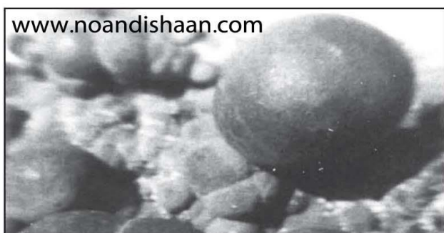
شکل ۴- توپهایی قارچ مانند از کوراندوم خالص که تحت حرارت الکتریکی در انتهای کوره شکل گرفته‌اند.