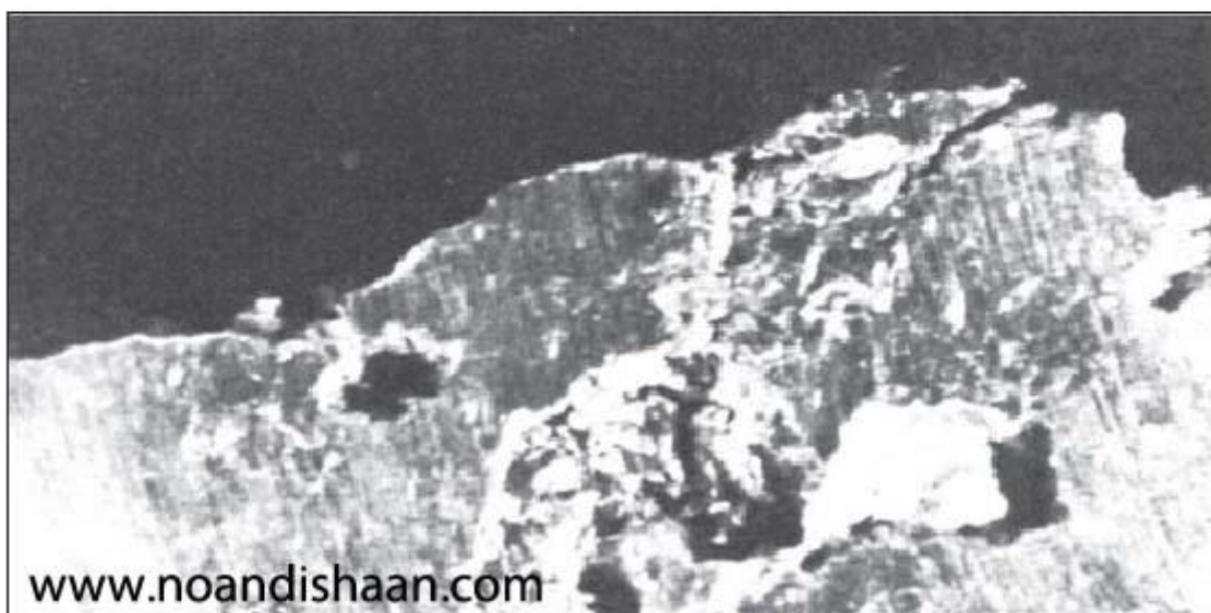
شکل ۲- قطعه‌ای که شامل سربار مواد می‌باشد. این سربار از ملاقه به قطعه منتقل شده است.

شکل 2 قسمتی از یک قطعه ریختگی را نشان می‌دهد که در آن مواد اکسیدی نرم از طریق ملاقه وارد مذاب شده و با بقیه آلومینیم تزریق شده است. حتی اگر اکسید را نتوان دید، مواد اکسیدی (سربار) بصورت شاخکهای چنگالی شکل در آمده و بطور محسوسی قطعه را ضعیف ساخته و باعث ایجاد مسیر نشستی در قطعات تحت فشار می‌شود. مواد اکسیدی (سربار) می