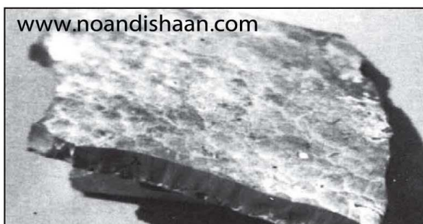
شکل ۳- تقریباً کوراندوم خالص که از دیواره کوره ذوب جدا شده است.

بنابراین کنترل ذرات سخت و عدم راهیابی آنها به داخل مذاب یکی از وظایف و اهداف مدیریت تمیزکاری کوره حمل مذاب به شمار می‌رود. به دلیل ته نشین شدن بسیاری از مواد سخت، یکی از راهکارهای مهم برای جلوگیری از داخل شدن این ذرات به داخل مذاب، دادن زمان کافی به آنها برای ته نشین شدن در انتهای کوره پس از تمیز کردن آن می‌باشد. بنابراین این موضوع، که به کوره‌هایی که به تازگی تمیز شده فرصت کافی جهت ته نشینی ذرات معلق در آن داده شود و مذاب آن برای مدتی مغشوش و پخش نشود، بسیار مهم و بحرانی می‌باشد. این زمان ممکن است 1 یا 2 ساعت و یا حتی در مواقعی بیشتر باشد، ولی به هر قیمتی باید از خالی کردن مذاب کوره پس از تمیز کردن آن پرهیز شود و از هر دقیقه برای ساکن نگه داشتن مذاب استفاده کنید، حتی اگر از زمان ایده آل نیز کمتر باشد.