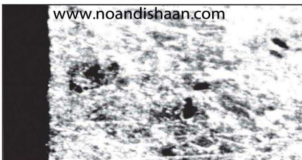
www.noandishaan.com شکل ۸- کوراندوم بسیار ریز که باعث خوردگی شدید ابزار می گردد.