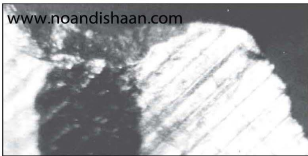
www.noandishaan.com شکل ۶- کوراندوم خالص بزرگی که در بیستون موتور دیده می شود.