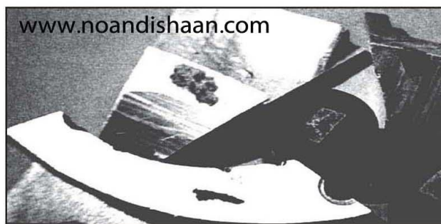
www.noandishaan.com شکل ۵- نمونه ای از نقاط سخت در قطعه ریختگی. این ذرات کوراندوم معمولاً از دیواره کوره ذوب ناشی می شوند.